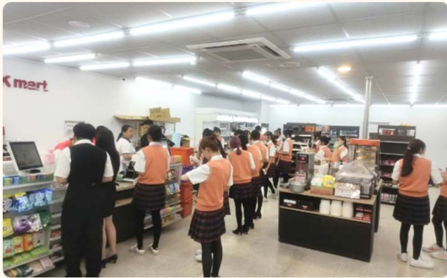
寬敞明亮舒適氛圍