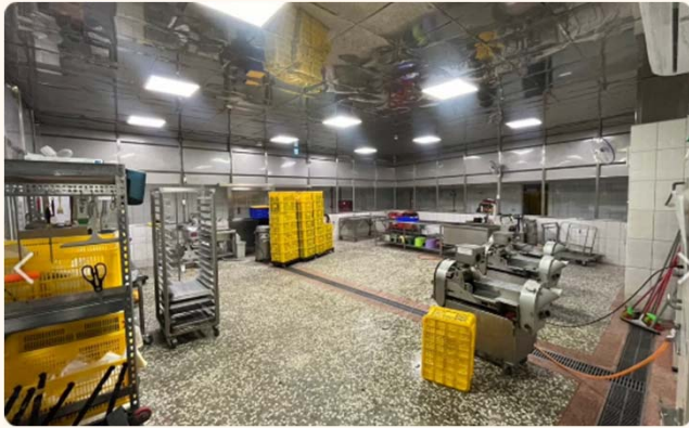
食品安全衛生管理(HACCP)中央廚房(嘉義)