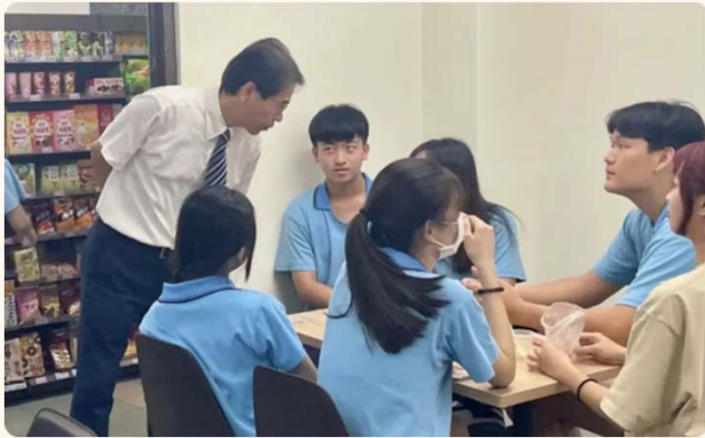
溫馨品味吸引學子