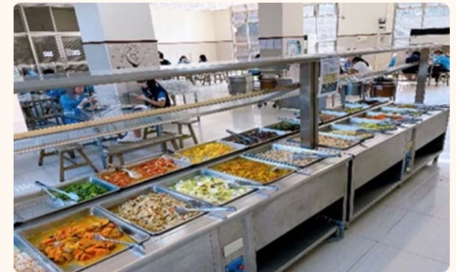
多樣化選擇自助餐(大林)