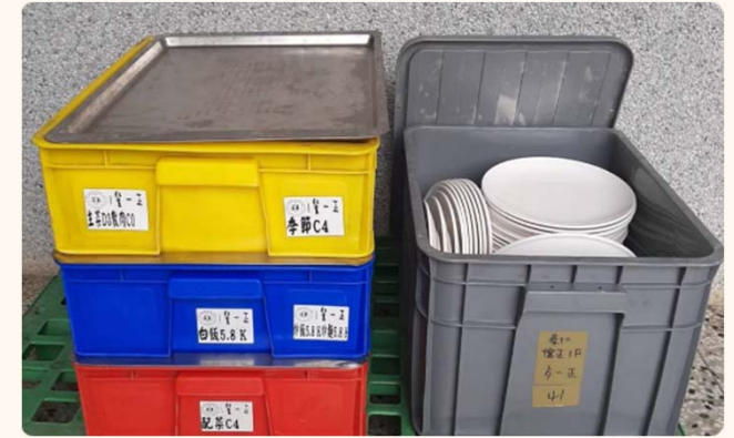
團膳供應食材與餐具(嘉義)