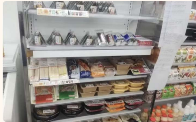
時尚供食多樣新鮮