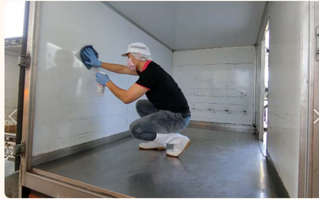
出餐餐車消毒清潔(嘉義)