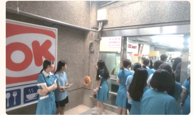
門庭若市多元選擇