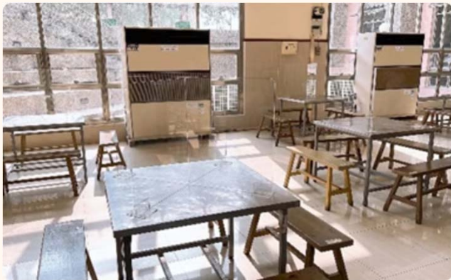
窗明几淨餐廳環境(大林)