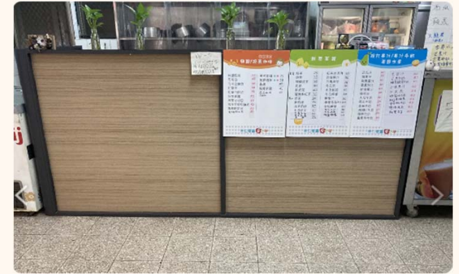
特色攤位多樣選擇