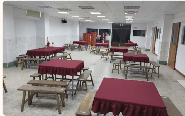
清爽宜人用餐空間