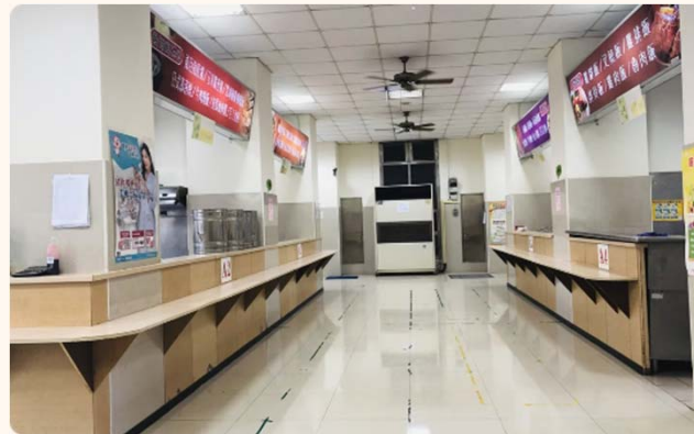
舒適乾淨選餐空間(大林)